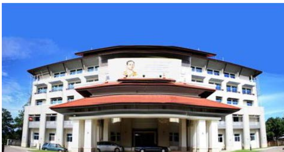
ภาพที่ 2 แสดงองค์การบริหารส่วนจังหวัดสตูล

องค์การบริหารส่วนจังหวัดสตูล ตั้งอยู่ที่ 888 ถนนยนตรการกำธร หมู่ที่ 6 ตำบลคลองขุด อำเภอเมือง จังหวัดสตูล 91000